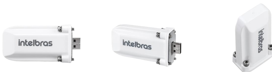
Foto do Pocket Wi-Fi EPW 2000 aplicado