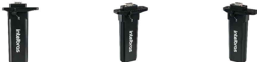
Foto do Pocket Wi-Fi EPWS 2000 aplicado