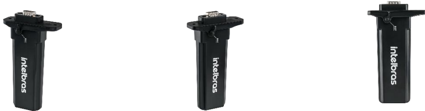
Foto do Pocket Wi-Fi EPWS 2000 aplicado