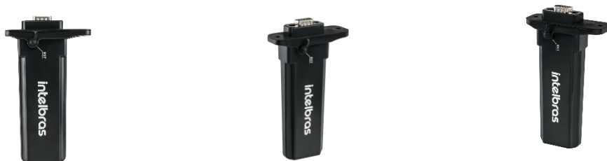
Foto do Pocket Wi-Fi EPWS 2000 aplicado